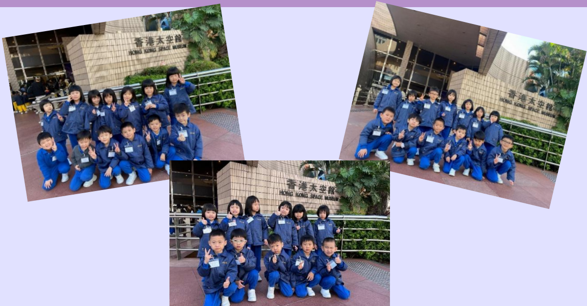
高班幼兒一起在香港太空館前拍照留念。