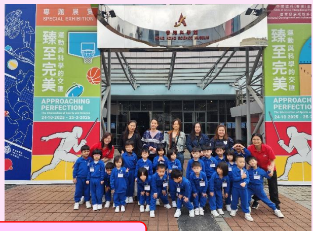
幼兒在香港科學館前拍照留念。